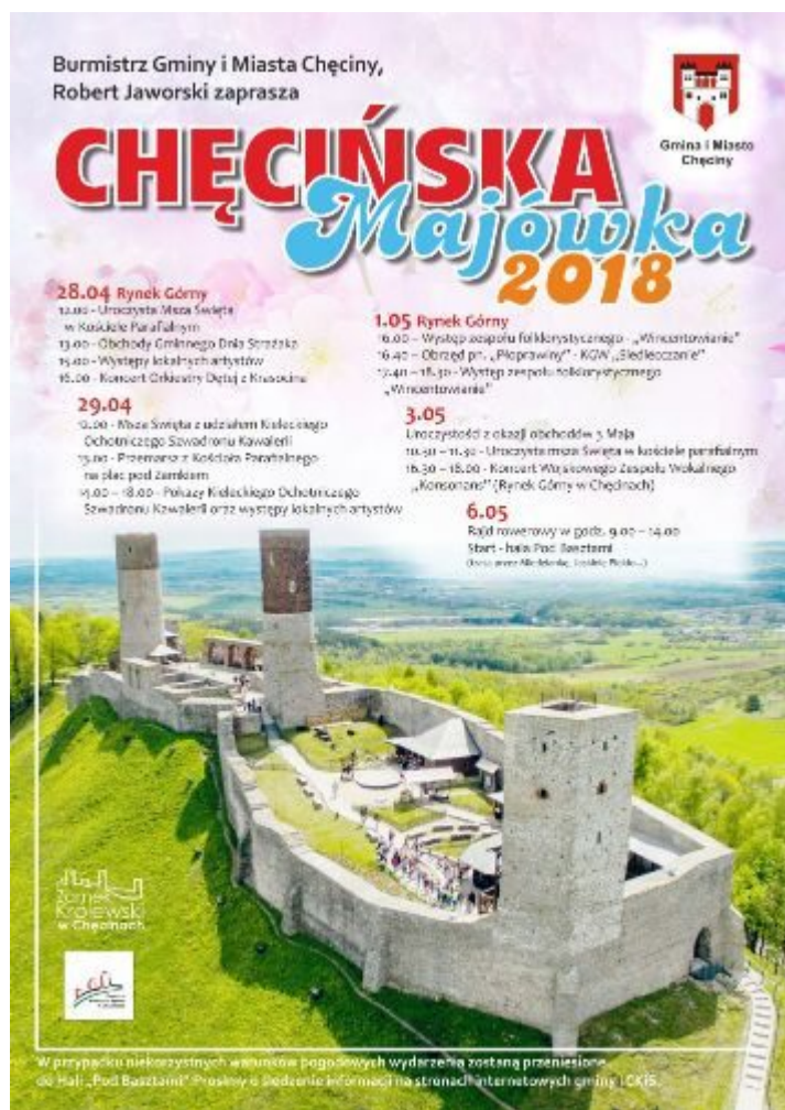
Plakat promujący wydarzenie