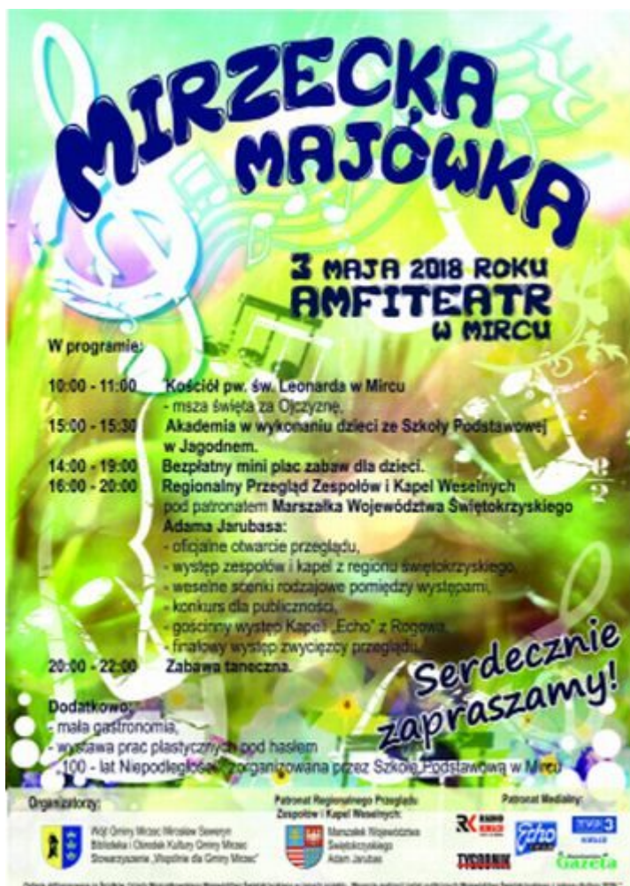
Mirzecka majówka plakat

Sandomierz to jedna ze świętokrzyskich “perełek” turystycznych. Ci, którzy jeszcze nie mieli szansy odwiedzić “małego Rzymu” mogą to uczynić podczas zbliżającego się długiego weekendu.