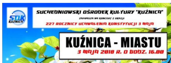
Plakat koncertu "Kuźnica-Miastu"