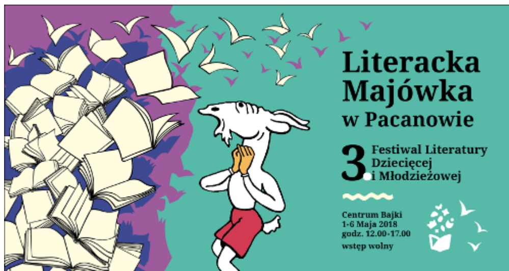
Plakat promujący wydarzenie

Na majówkę zaprasza także Teatr Żeromskiego w Kielcach . W dniach 28-29 kwietnia i 3 maja będzie okazja obejrzyć spektakl „Prędko, prędko” . Nowe spojrzenie na Fredrę – najwybitniejszego polskiego komediopisarza, prezentuje Mikołaj Grabowski, znakomity reżyser, aktor teatralny i filmowy, pedagog, profesor krakowskiej PWST, dyrektor wielu scen polskich Początek o godz. 19.00 . Natomiast 5-6 maja Teatr zaprasza na spektakl „Hotelowe manewry” . Zabawną, pełną nieoczekiwanych zwrotów akcji opowieści o kataklizmach dziejących się tuż przed koncertem dwóch nienawidzących się gwiazd w luksusowym hotelu Royal. Więcej