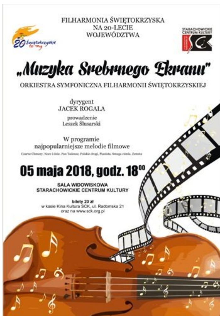
Plakat promujący wydarzenie

W sobotę, 5 maja w Starachowickim Centrum Kultury będzie okazja posłuchać melodii filmowych z takich filmów jak „Pan Tadeusz” czy „Pianista” w wykonaniu Orkiestry Symfonicznej Filharmonii Świętokrzyskiej. Koncert odbędzie się w ramach jubileuszu 20 - lecia województwa świętokrzyskiego. Więcej