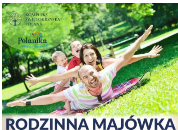
Plakat Majówka Świętokrzyska Polana

Ci, którzy jeszcze nie zaplanowali wypoczynku na przełomie kwietnia i maja, mogą skorzystać z bogatej oferty Kompleksu Świętokrzyska Polana . Położony na otoczonej lasem polanie ośrodek kusi nie tylko profesjonalnymi zabiegami rehabilitacyjnymi i noclegami w pokojach o wysokim standardzie, ale także: wielkimi akwariami, w których pływają ryby i wodne stworzenia z całego świata, świętokrzyskimi zabytkami w miniaturze i ogromnym placem zabaw dla dzieci.