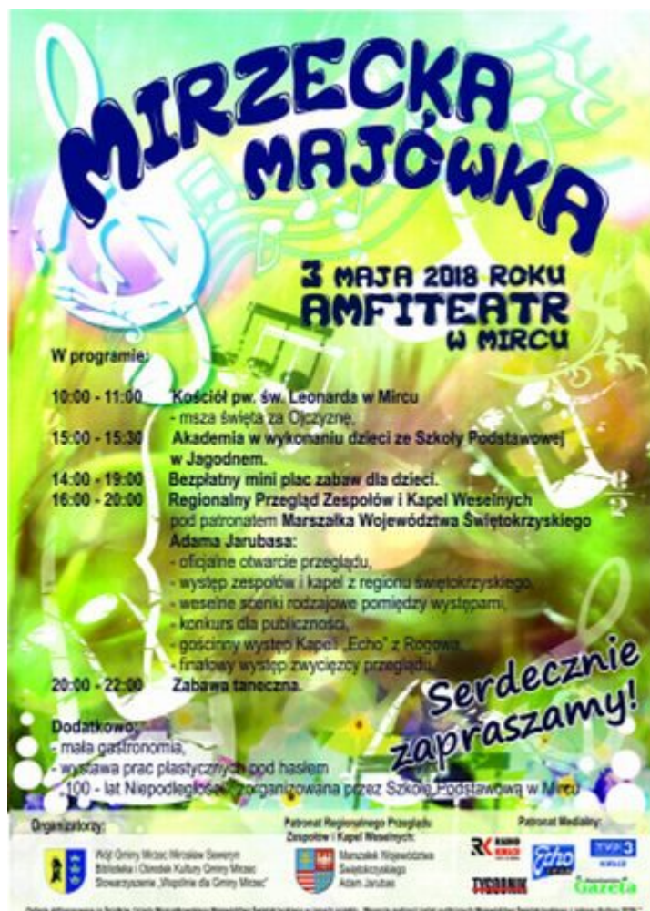
Mirzecka majówka plakat

Sandomierz to jedna ze świętokrzyskich “perełek” turystycznych. Ci, którzy jeszcze nie mieli szansy odwiedzić “małego Rzymu” mogą to uczynić podczas zbliżającego się długiego weekendu.