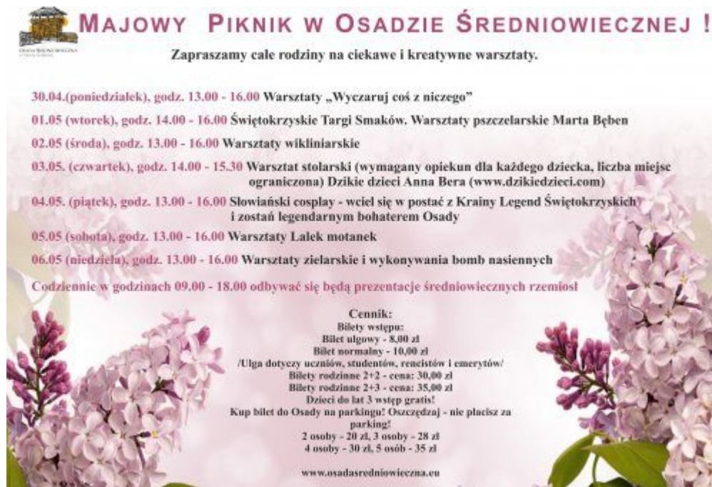
Plakat promujący wydarzenie

Muzeum Narodowe w Kielcach zaprasza 28 kwietnia i 5 maja na warsztaty rodzinne. 28 kwietnia najmłodszy dowiedzą się kto to taki grafik i czym się zajmuje. Natomiast 5 maja uczestnicy poznają symbole narodowe oraz zwiedza wystawę Sanktuarium Marszałka Piłsudskiego i dowiedzą się, co to jest patriotyzm. Zajęcia zakończą warsztaty plastyczne. Warsztaty rodzinne odbędą się w Dawnym Pałacu Biskupów Krakowskich w Kielcach. Początek o godz. 11.00 . Więcej