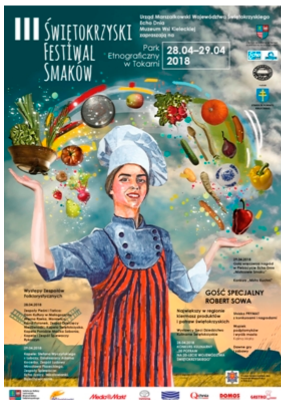
Plakat promujący wydarzenie

Gotowanie w plenerze, prezentacja regionalnych produktów, kiermasze, dawne gry i zabawy, występy artystyczne, konkursy nagrodami - to tylko niektóre z atrakcji III Świętokrzyskiego Festiwalu Smaków , który odbędzie się 28 i 29 kwietnia w Parku Etnograficznym w Tokarni w ramach obchodów jubileuszu 20 - lecia województwa świętokrzyskiego. W programie imprezy - występy kapel ludowych, dawne gry i zabawy dla najmłodszych, konkurs kulinarny „20 potraw na 20 - lecie Województwa Świętokrzyskiego”, konkurs Świętokrzyski Mistrz Kuchni. Więcej