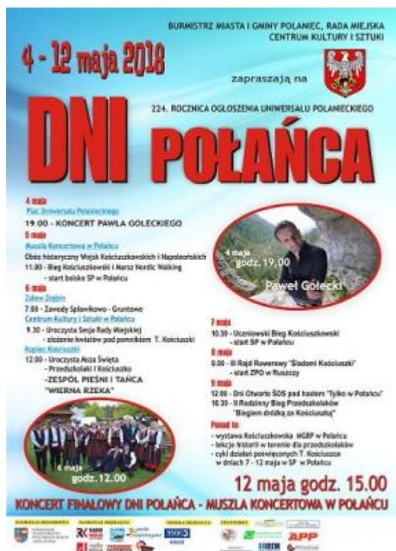
Plakat promujący wydarzenie