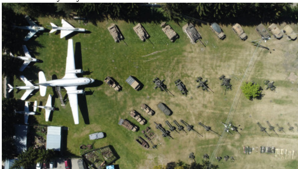
Muzeum Orła Białego w Skarżysku-Kamiennej

Niedaleki Wąchock ściśle związany jest z tradycją obecnego tu przez wieki zakonu cystersów w Polsce. Bracia ci, już na początku XII wieku pojawili się na tych ziemiach, rozwijając zarówno rolnictwo, jak i zakładając warsztaty kamieniarskie, tkackie, kamieniołomy, piece dymarkowe i hutnicze. Jednak historia tych ziemi sięga o wiele głębiej – do epoki paleolitu i mezolitu, bo tu właśnie, na terenie obecnego Rezerwatu Archeologicznego Rydno odnaleziono ślady życia ludzi sprzed 50 tysięcy lat, osady, łowców