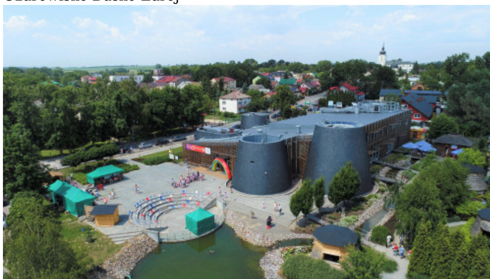
Europejskie Centrum Bajki w Pacanowie

Do ziemi buskiej warto przyjechać przede wszystkim, by zadbać o swoje zdrowie, kondycję