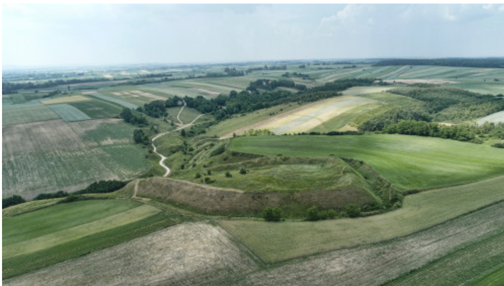
Pozostałości grodu plemienia Wiślan w Stradowie