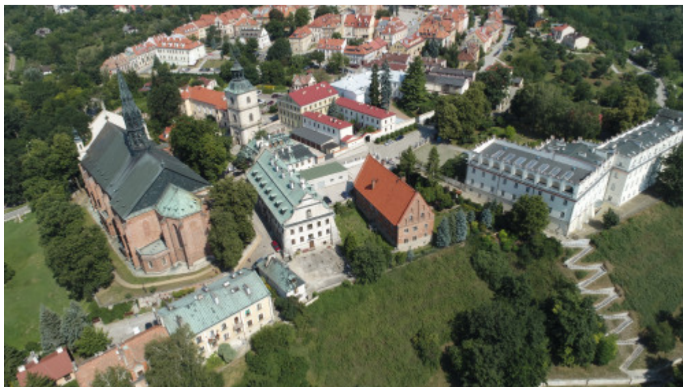
Sandomierz zaprasza miłośników historii i zabytków