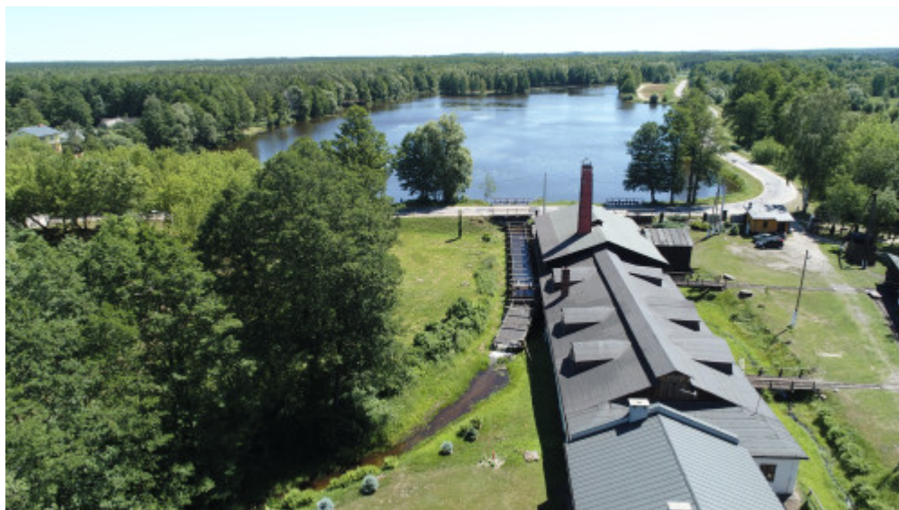
Zabytkowy Zakład Hutniczy w Maleńcu

Wędrując po ziemi świętokrzyskiej warto odpocząć właśnie tutaj - w okolicach Końskich. To tereny lesiste, położone wzdłuż rzeki Czarnej i jej dopływów, z ciekawymi szlakami rowerowymi i zbiornikami wodnymi - chociażby popularną Sielpią. Tu również odnajdziemy interesujące formy skalne - w okolicy Niekłania wart obejrzenia jest rezerwat Piekło z pochodzącymi z okresu triasu i jury, powstałymi na skutek erozji skałami w formie grzybów, kazalnicy czy kominów. Z rezerwatu i leżącej nieopodal wioski Piekło zaledwie krok do Nieba - kolejnej miejscowości na turystycznym szlaku. Konecczynna to także świadek świetności przemysłu ciężkiego na tych ziemiach, którego ślady odnajdziemy w Zabytkowym Zakładzie Hutniczym w Maleńcu, w Sielpi, w Starej Kuźnicy.