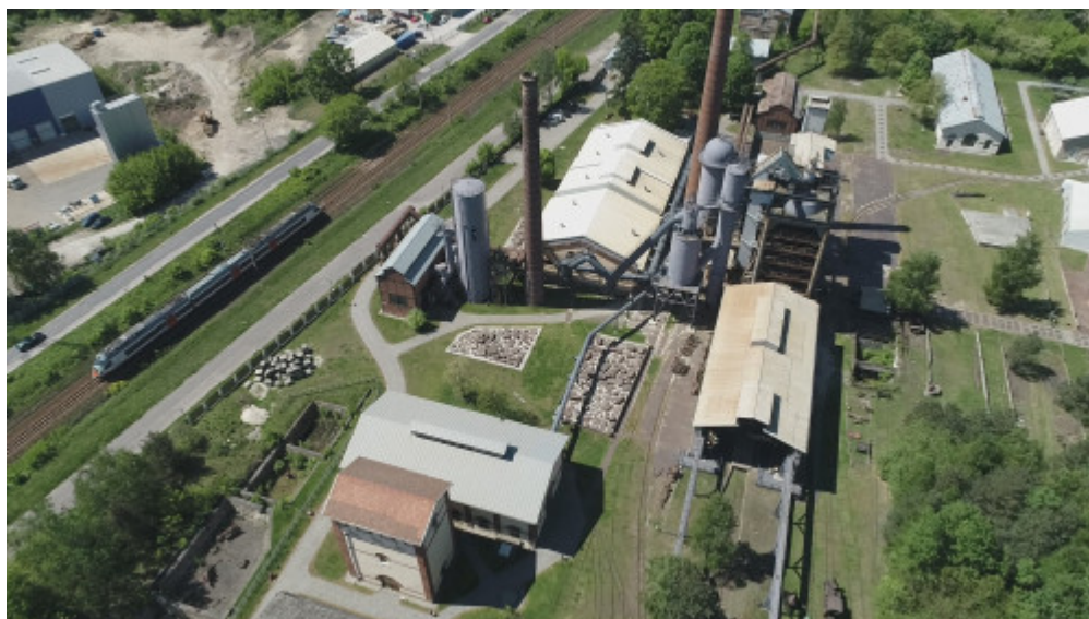
Muzeum Przyrody i Techniki