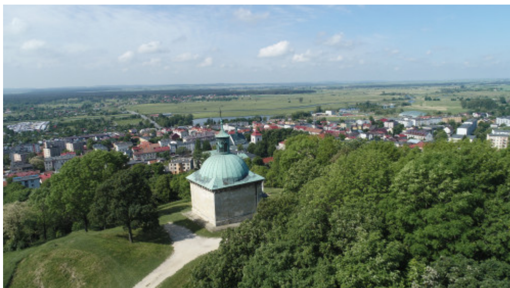
Kaplica św. Anny w Pińczowie