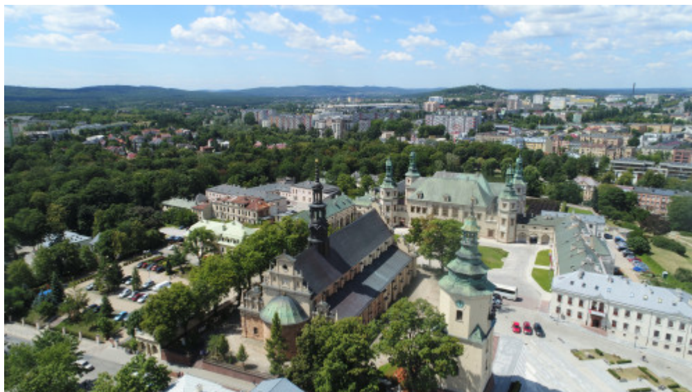
Wzgórze katedralne w Kielcach

W sercu Świętokrzyskiego leży stolica regionu - Kielce. To raj dla miłośników geologii, którzy poznają dawną historię ziemi, walory przyrodnicze i krajobrazowe miasta, świadectwo górniczej przeszłości, odwiedzając pięć rezerwatów geologicznych. Na wzgórzu zamkowym góruje pałac biskupów krakowskich - XVII-wieczna okazała budowla, będąca siedzibą Muzeum Narodowego, z pięknym ogrodem włoskim i sąsiadującą bazyliką katedralną oraz położonym w niewielkiej odległości XI-wiecznym kościołem świętego Wojciecha. To także centrum kulturalne regionu, gdzie odbywają się interesujące spotkania muzyczne, przedsięwzięcia teatralne, koncerty, festiwale, międzynarodowe wystawy, imprezy sportowe. Kielce są ważnym ośrodkiem targowym, a organizowane branżowe imprezy wystawiennicze przyciągają do regionu inwestorów i przedstawicieli biznesu z różnych stron świata.