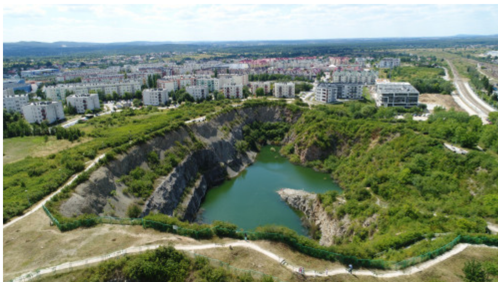
Rezerwat geologiczny na kieleckich Ślichowicach