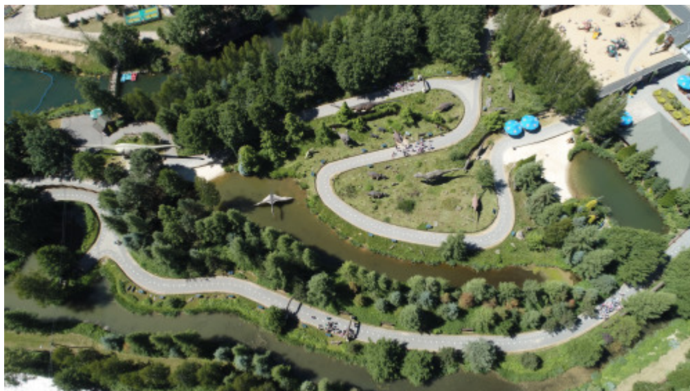
Park Jurajski w Bałtowie

Wędrówkę po ziemi świętokrzyskiej kontynuujemy, śledząc dolinę rzeki Kamiennej. Przed nami skarb z prehistorii – neolityczne kopalnie krzemienia w Krzemionkach koło Ostrowca Świętokrzyskiego, unikalne miejsce, w którym 5 tysięcy lat przed naszą erą wydobywano i przetwarzano krzemień pasiasty, tworząc ostrza siekier czy dłut. Obecnie to rezerwat, w którym oglądać można korytarze kopalń, szyby i hałdy górnicze, a także wioskę neolityczną, będącą rekonstrukcją osady z epoki kamienia i wczesnej epoki brązu.