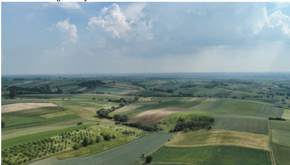
Malownicze krajobrazy ziemi kazimierskiej

Ziemia kazimierska to tereny typowo rolnicze, a to dzięki obecności skał lessowych, na których wykształciły się urodzajne czarnoziemy i gleby brunatne. Przeważa tu produkcja zbóż, warzyw, roślin przemysłowych i pastewnych. Nie brak także gospodarstw ekologicznych. Już od lat 60-tych ubiegłego stulecia wiadomo było również o bogatych złożach wód siarczkowych i termalnych, ukrytych właśnie tutaj, na terenie powiatu kazimierskiego, w okolicach Cudzynowic. Woda ta, bogata w jod, brom, związki siarki, może być wykorzystywana zarówno w lecznictwie, jak i w kosmetologii. To także potencjalne źródło ciepła, które może zastąpić tradycyjną energię w ogrzewaniu budynków użyteczności publicznej. Obecność wody, bogatej w składniki mineralne udowodniły przeprowadzone