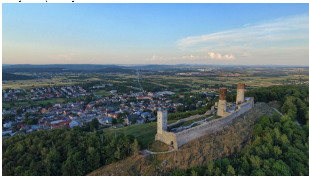
Zamek Królewski w Chęcinach

Docieramy do serca regionu, najstarszych w Polsce Gór Świętokrzyskich. Tu przed milionami lat szumiało morze, którego ślady w postaci skamieniałości koralowców, trylobitów i ryb pancernych odnaleźć można w skałach. Na przemian zalewane przez morze i poddawane procesom wypiętrzania, obecnie Góry Świętokrzyskie to strome stoki z lasami jodłowymi, piękne doliny i charakterystyczne gołoborza, pozostałości po okresach zlodowaceń. W najważniejszym paśmie górskim - Łysogórach - górują Łysica i Łysiec, na