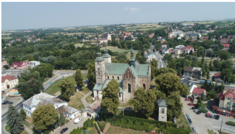
Kolegiata św. Marcina w Opatowie