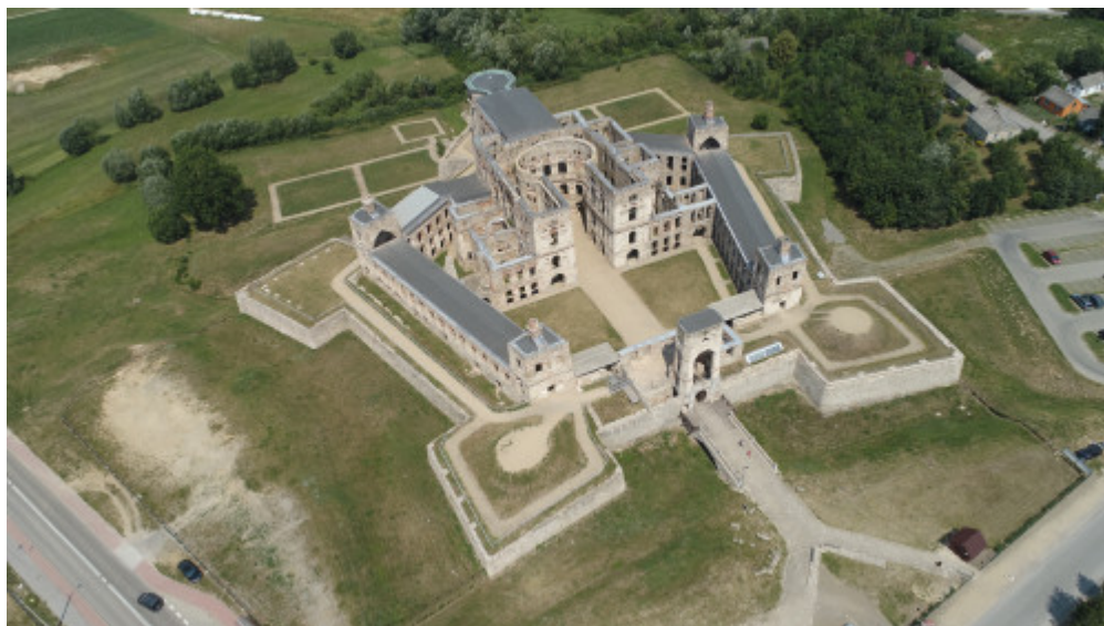
Zamek Krzyżtopór w Ujeździe