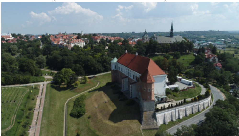
Zamek Królewski w Sandomierzu

Z biegiem Wisły docieramy do perły ziemi świętokrzyskiej – Sandomierza. To jedno z najstarszych i najważniejszych miejsc historycznych Polski. „Mały Rzym” – położony na siedmiu wzgórzach, wspominany w kronice Galla Anonima, uznawany był za jeden z 3 głównych grodów kraju. Sandomierz przetrwał najazdy Tatarów, Litwinów, a później potop szwedzki. Obecnie to miejsce, gdzie podziwiać można niezliczone zabytki. Tuż nad Wisłą wznosi się zamek królewski, wybudowany za panowania Kazimierza Wielkiego, gdzie obecnie znajduje się muzeum regionalne. Od zamku droga wiedzie do zabytkowej zabudowy starego miasta, otoczonego murami miejskimi, z pięknym ratuszem, Bramą Opatowską, z której oglądać można panoramę miasta i okolic, pojezuickim Collegium Gostomianum,