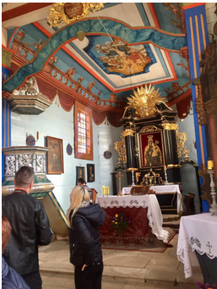
Odnowiony kościółek z Rogowa