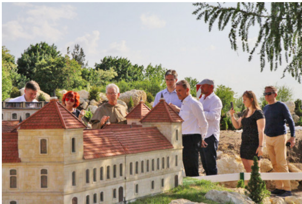
Zwiedzanie zamków w miniaturze w Bałtowie

widać po ostatnich rekordach liczby turystów.