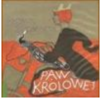
Dorota Masłowska - „Paw Królowej”

Czytelnicy mogą głosować wypełniając formularz na stronach internetowych lub wypełniając karty do głosowania dostępne w siedzibach organizatorów konkursu.