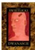
Marcin Świetlicki - „Dwanaście”