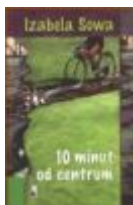
Izabela Sowa - „Dziesięć minut do centrum”

Uczestniczą w nim czytelnicy, którzy głosują na ich zdaniem najciekawszą i najlepszą książkę wybraną spośród utworów współczesnych autorów polskich. Do tytułu „Książki Lata” Kapituła Konkursu zaproponowała cztery tytuły: