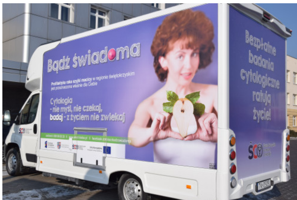
Plakat informujący o wydarzeniu