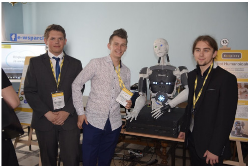
Młodzi naukowcy prezentują innowacyjne badania naukowe

Podczas wydarzenia młodzież prezentuje 36 projektów naukowych, wyłonionych podczas ogólnopolskiej rekrutacji. Spośród nich jury konkursu wybierze najlepsze, które otrzymają akredytacje na ogólnopolski finał Konkursu w Gdyni. Tam będą się ubiegali o stypendia naukowe oraz możliwość reprezentowania Polski na prestiżowych konkursach zagranicznych dla młodzieży w USA i Rumunii.