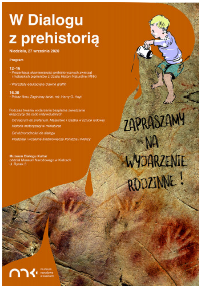
Plakat W Dialogu Z Prehistorią