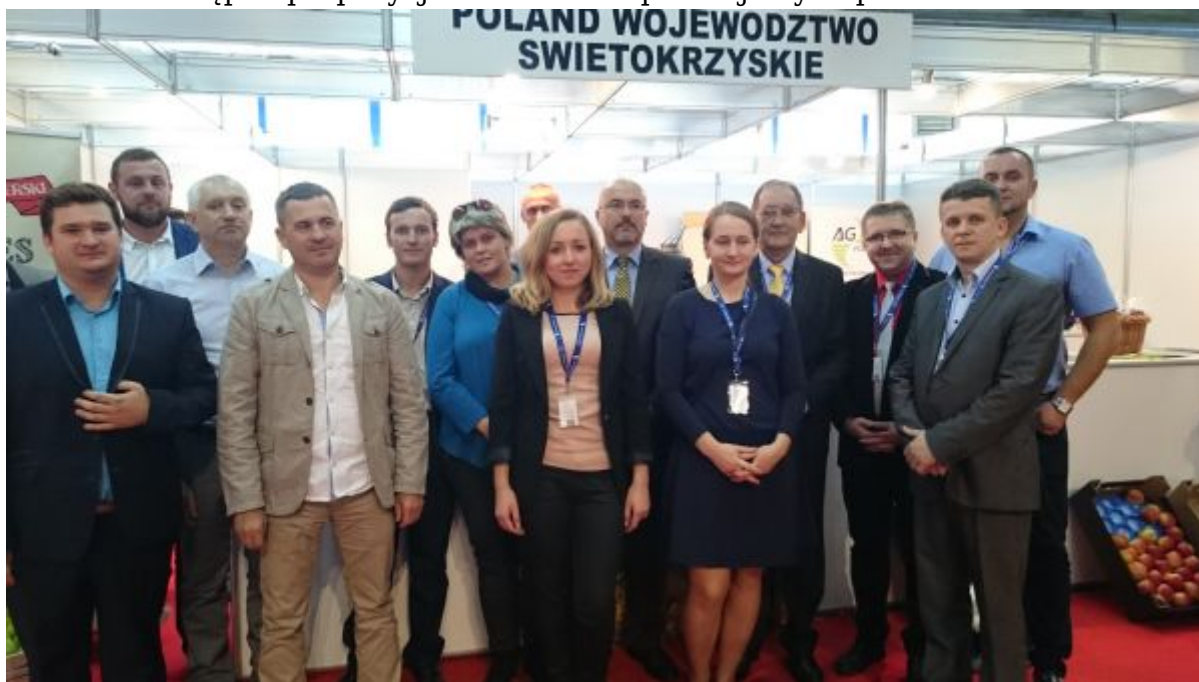
Delegacja regionu świętokrzyskiego na wystawie w Bukareszcie