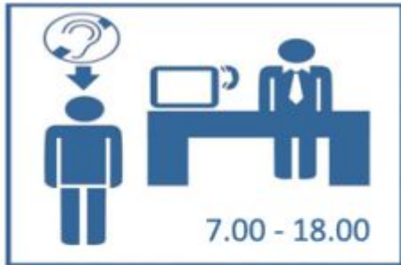
1. Osoba niesłysząca w instytucji publicznej.

Schemat działania Systemu Komunikacji Niewerbalnej w kasie biletowej: