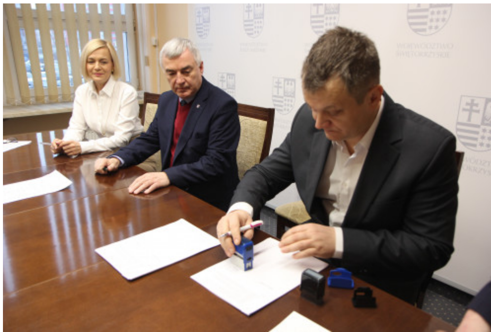
Umowa z Fundacją Nadzieja Rodzinie