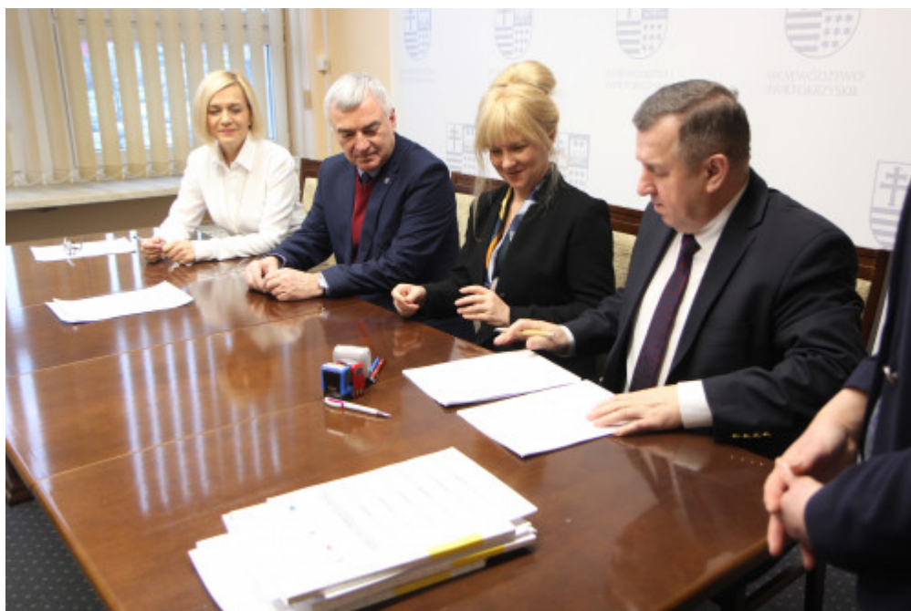
Podpisanie umowy z gminą Bodzechów

Gmina Bodzechów realizować będzie projekt o wartości 3 783 505, 86 zł. Dofinansowanie w ramach działania 9.2.1 Rozwój wysokiej jakości usług społecznych wyniesie 3 438 482,22 zł. Celem projektu jest wsparcie rodzin z terenu gminy Bodzechów w procesie przygotowania dzieci i młodzieży do samodzielnego życia oraz pomoc dla rodziców w zakresie wychowania. Projekt zakłada wsparcie 390 osób, w tym 195 dzieci z rodzin ubogich materialnie oraz zaniedbywanych wychowawczo. Świetlice środowiskowe zostaną utworzone w miejscowościach: Bodzechów, Gromadzice, Magonie, Świrna, Miłków, Mychów, Goździelin. W ramach funkcjonowania placówek dzieci będą miały zapewnioną pomoc m.in. w nauce i uzupełnieniu zaległości edukacyjnych, organizowaniu czasu wolnego – prowadzenie zajęć (plastycznych, sportowych, kulinarnych, informatycznych, teatralno-muzycznych). Rodziny otrzymają wsparcie psychologiczne i prawne.