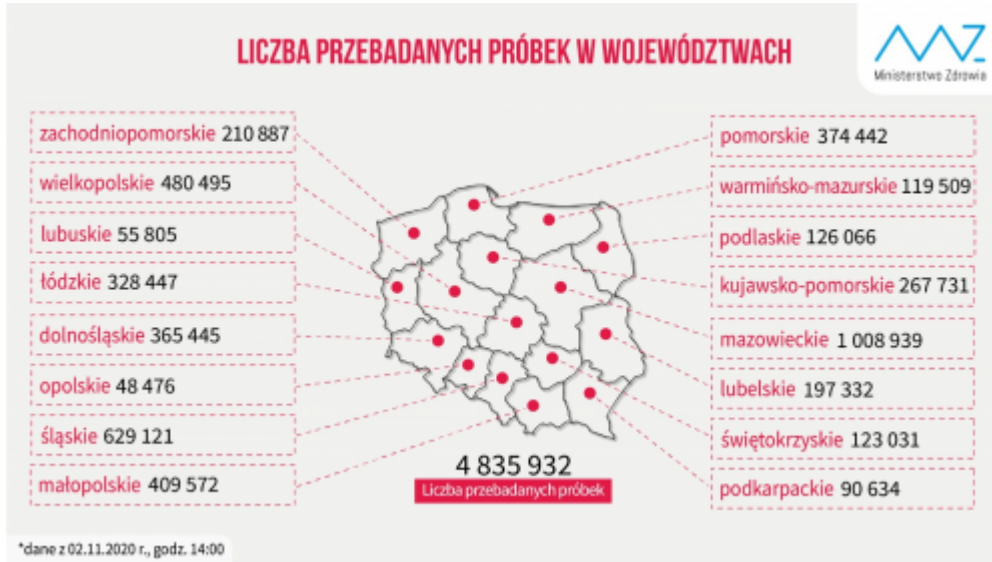
Liczba przebadanych próbek - grafika Ministerstwa Zdrowia

Ostatnio wykonuje się tam około 1000 testów na dobę, a od marca przebadano ponad 56 tysięcy próbek. Z danych tych wynika, że co drugi przebadany mieszkaniec regionu miał wykonywany test właśnie w Podzamczu.