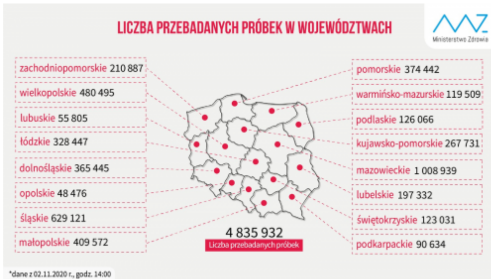
Liczba przebadanych próbek - grafika Ministerstwa Zdrowia

Ostatnio wykonuje się tam około 1000 testów na dobę, a od marca przebadano ponad 56 tysięcy próbek. Z danych tych wynika, że co drugi przebadany mieszkaniec regionu miał wykonywany test właśnie w Podzamczu.