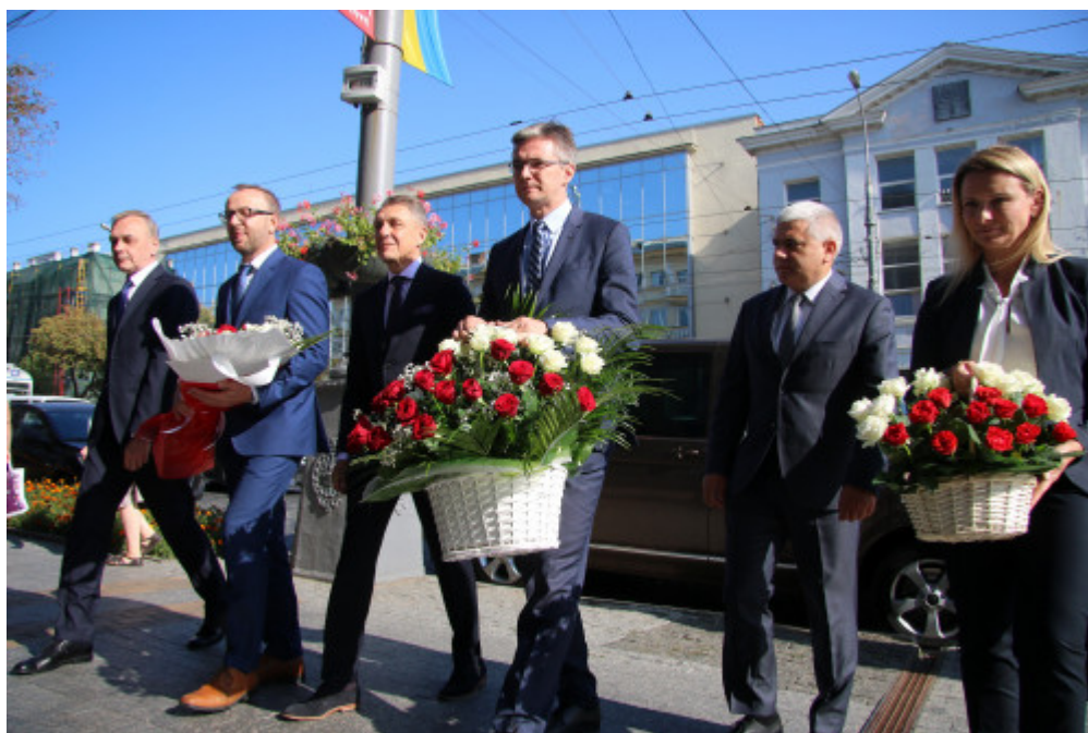
Złożenie kwiatów pod tablicą Marszałka Józefa Piłsudskiego