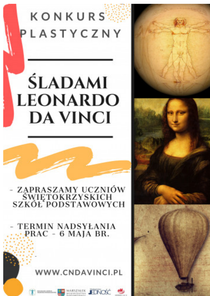
Plakat informujący o konkursie