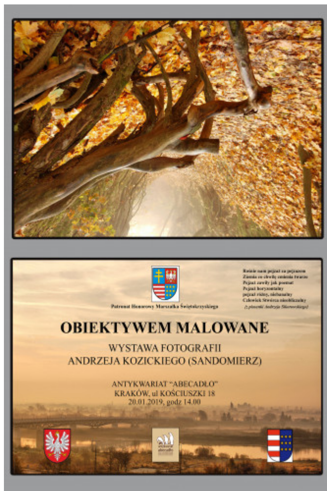
Folder informujący o wydarzeniu