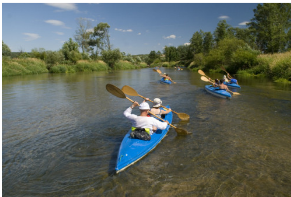
Świętokrzyskie - Kajaki Nida