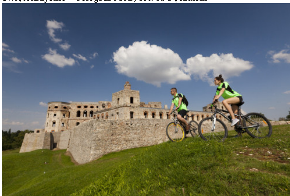
Świętokrzyskie - Ujazd, Zamek Krzyżtopór, fot. K. Pęczalski