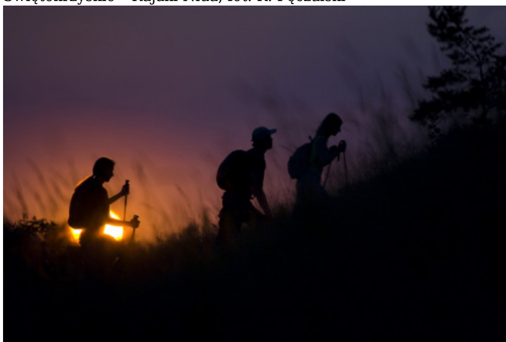
Świętokrzyskie - Turystyka Piesza