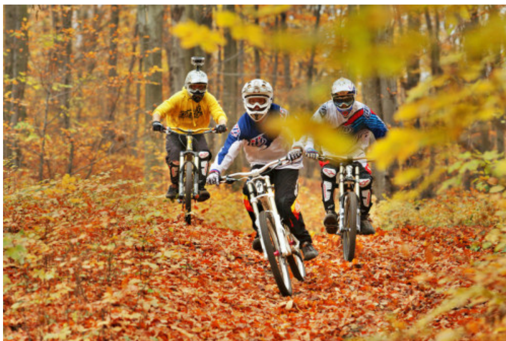
Świętokrzyskie - Telegraf MTB