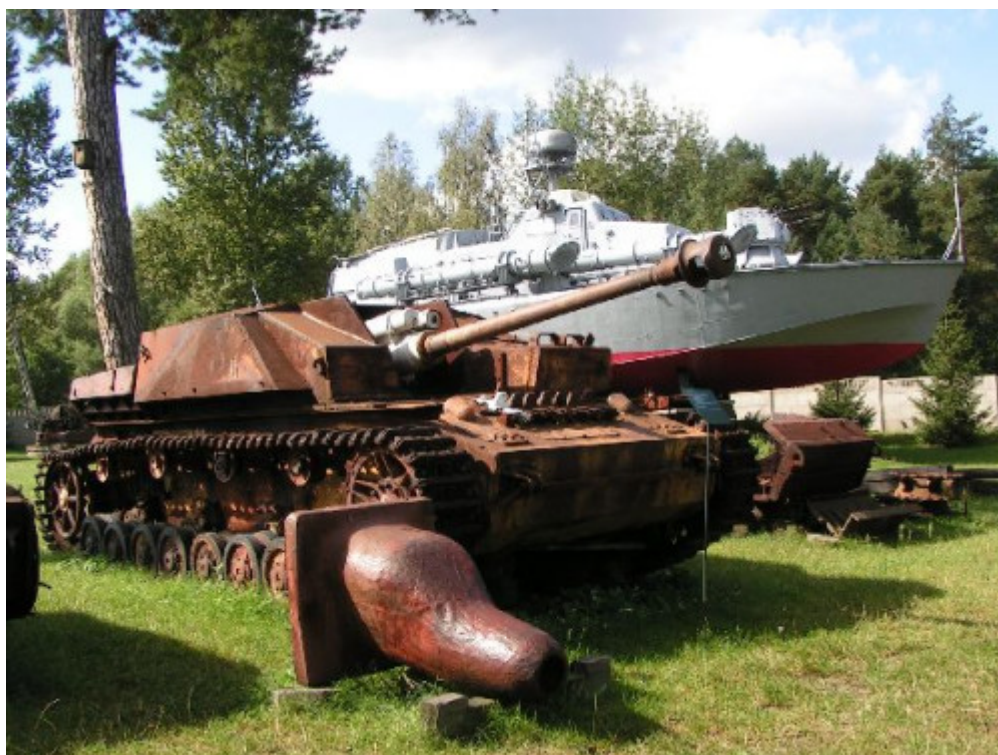
Muzeum Orła Białego

Fascynuje Was historia? A może lubicie militaria? Muzeum im. Orła Białego w Skarżysku-Kamiennej , w województwie świętokrzyskim działa od 1969 r. i mieści się w zabytkowym budynku huty „Rejów” z XIX w. Tutejsze zbiory postrzegane są jako drugie, po Muzeum Wojska Polskiego, zgromadzono tu przede wszystkim historyczny sprzęt wojskowy, ale także różnego rodzaju dokumenty czy umundurowanie i przyrządy wojskowe. W ramach stałych ekspozycji zobaczyć tu można: eksponaty dotyczące wojny obronnej z 1939 r., czy też wyposażenie i umundurowanie żołnierzy Wojska Polskiego z okresu kampanii wrześniowej. Największym zainteresowaniem wśród turystów cieszy się jednak ekspozycja plenerowa, na której zgromadzono działa artyleryjskie, armaty przeciwpancerne i przeciwlotnicze, czołgi, wozy pancerne i samoloty wojskowe. Unikatowym w skali kraju eksponatem jest pełnomorski kuter torpedowy ORP „Odważny” oraz niemieckie samobieżne działo pancerne