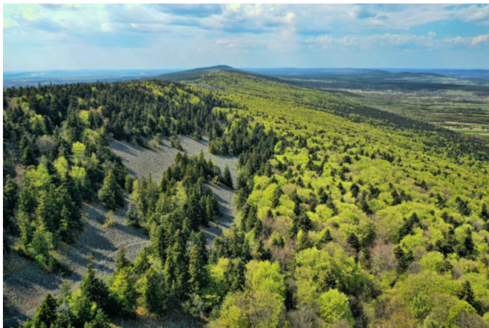
Góry Świętokrzyskie- Gołoborze

Będąc w Świętokrzyskiem warto zobaczyć miejsca, które są naszą największą wizytówką, jedyne i unikatowe, ciekawe, urokliwe, przez wielu odkrywane po raz pierwszy. Na pierwszym miejscu powinny pojawić się więc Góry Świętokrzyskie , najstarsze obok Sudetów góry w Polsce. Słynna Łysica i Góra Agaty (614 m n.p.m.) oraz Łysa Góra (595 m n.p.m.) to najwyższe ich wzniesienia. Góry obfitują w niezwykle rumowiska skalne – gołoborza, malownicze punkty widokowe, barwne lasy jodłowe i bukowe. Góry znajdują się na terenie Świętokrzyskiego Parku Narodowego. Biegnie przez nie główny szlak pieszy im. Edmunda Massalskiego o długości 92 km. z najpopularniejszym i najchętniej uczęszczanym przez turystów odcinkiem wzdłuż Pasma Łysogórskiego. Najcenniejszym zabytkiem na tym obszarze jest pobenedyktyński zespół klasztorny z przechowywanymi w nim relikwiami Drzewa Krzyża Świętego. Relikwie najprawdopodobniej podarował klasztorowi królewicz węgierski Emeryk – syn Stefana I, który miał przebywać w Polsce na zaproszenie Bolesława Chrobrego. Na terenie zespołu klasztornego znajdują się udostępnione do zwiedzania: Krypta Jeremiego Wiśniowieckiego oraz Muzeum Misyjne Misjonarzy Oblatów Maryi Niepokalanej. Nad kompleksem wznosi się odbudowana wieża, którą zburzyły w 1914 roku wojska austriackie. Z jej tarasu widokowego turyści podziwiają urzekającą świętokrzyską panoramę.