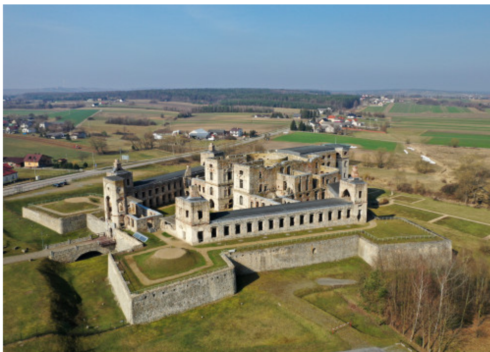
Zamek Krzyżtopór W Ujeździe

Uroczy jest też częściowo zrekonstruowany zamek krzyżtoporski. Zamek Krzyżtopór w Ujeździe , niedaleko Staszowa, 400 lat temu imponował ogromem, bogactwem wystroju, obronnością i – stylem wykonania. Rezydencja powstała jako największy, przed królewskim francuskim Wersalem, europejski pałac. Budowla inspirowana była kalendarzem – z 4 basztami obronnymi, 12 wielkimi salami, 52 pokojami i 365 drzwiami i oknami. Spośród wielu niezwykłych elementów w pałacu uwagę zwracał sufit sali jadalnianej, w którym umieszczono akwarium z egzotycznymi rybami, podziwiane były także piękne ogrody otaczające budowlę. Luksus i przepych wystroju podkreślał majątność i znaczenie możnego polskiego szlacheckiego rodu Ossolińskich. Dziś zwiedzać można ruiny fortecy, część rozległych sal, podziemne stajnie wraz z piwnicami oraz koronę murów obronnych.