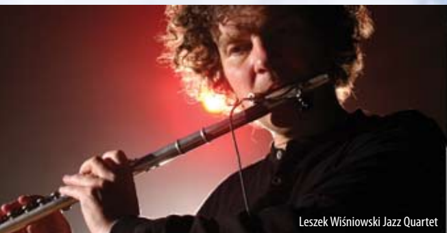
Leszek Wiśniowski Jazz Quartet