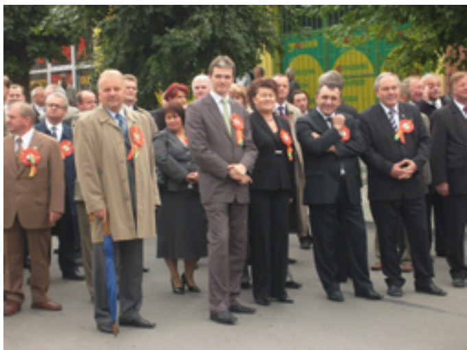
Święto plonów to dzień szczególny dla rolników i osób korzystających z owoców ich pracy