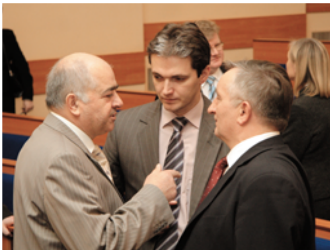
Ostatnie konsultacje przed głosowaniem