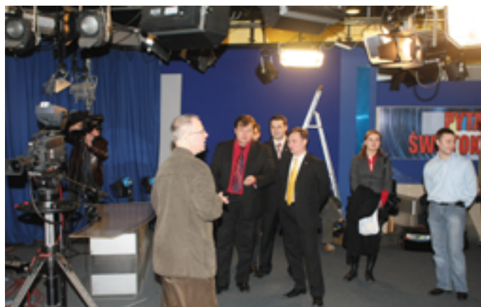
Ukraińscy dziennikarze odwiedzili studio TVP3 w Kielcach