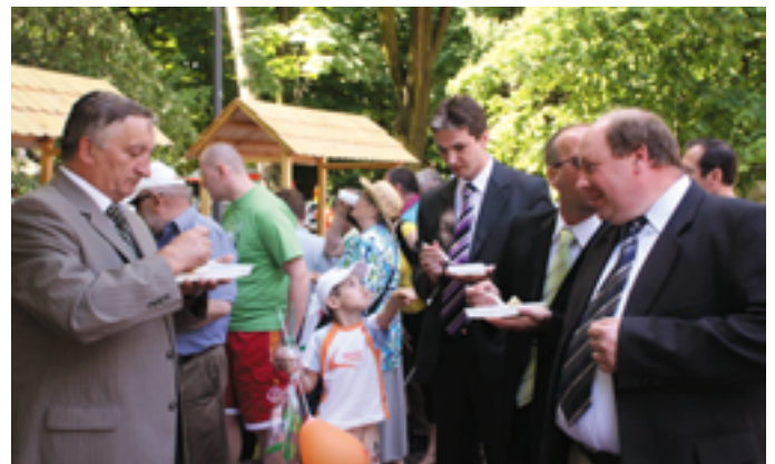
Świętokrzyskie przysmaki radowały podniebienia uczestników Pikniku