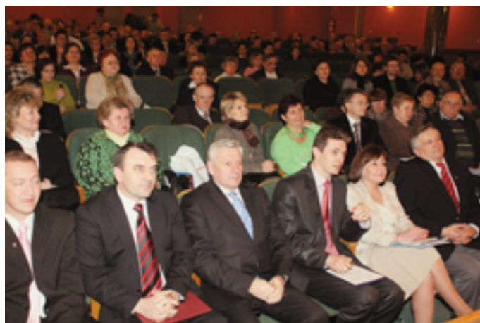
Uczestnicy II Kongresu Stowarzyszeń zapełnili salę WDK po brzegi

Spotkanie odbywało się w dwóch grupach tematycznych. Na pytania uczestników kongresu odpowiadali przedstawiciele Urzędu Marszałkowskiego oraz Świętokrzyskiego Biura Rozwoju Regionalnego.