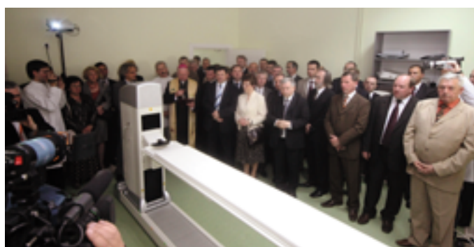
Uroczystość otwarcia ośrodka PET zgromadziła wielu znakomitych gości