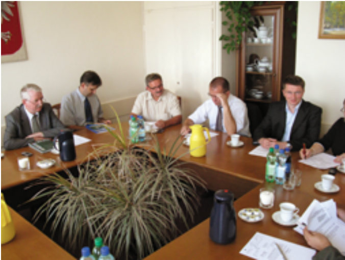
Radni podczas pracy w komisji

Radni byli również współinicjatorami opracowania i przyjęcia oświadczeń które dotyczyły: projektu ustawy o rozwoju miast i obszarów metropolitalnych, oraz jubileuszu 10-lecia Województwa Świętokrzyskiego.