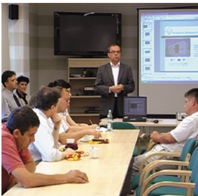
Winniczanie odwiedzili także nową siedzibę Wojewódzkiej Biblioteki Publicznej