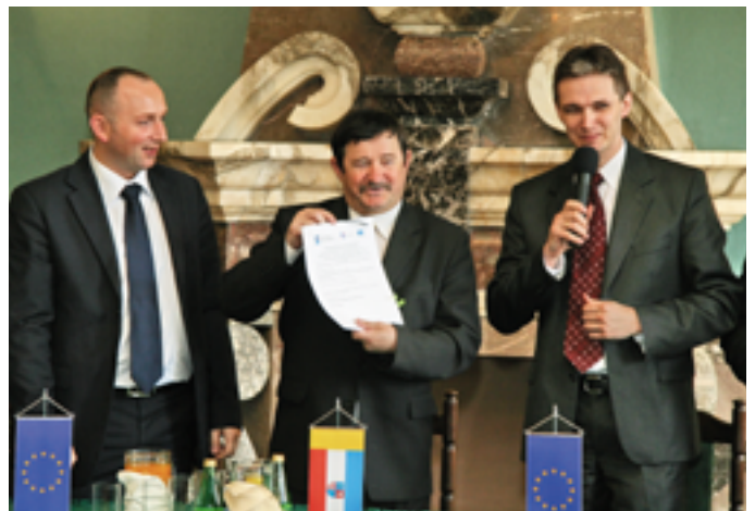
Pierwsza historyczna pre-umowa podpisana na realizację inwestycji w Wojewódzkim Szpitalu Zespolonym w Kielcach