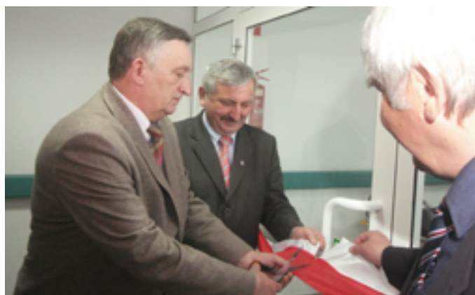
Uroczyste otwarcie nowego oddziału