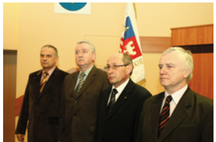
Nowi radni Sejmiku