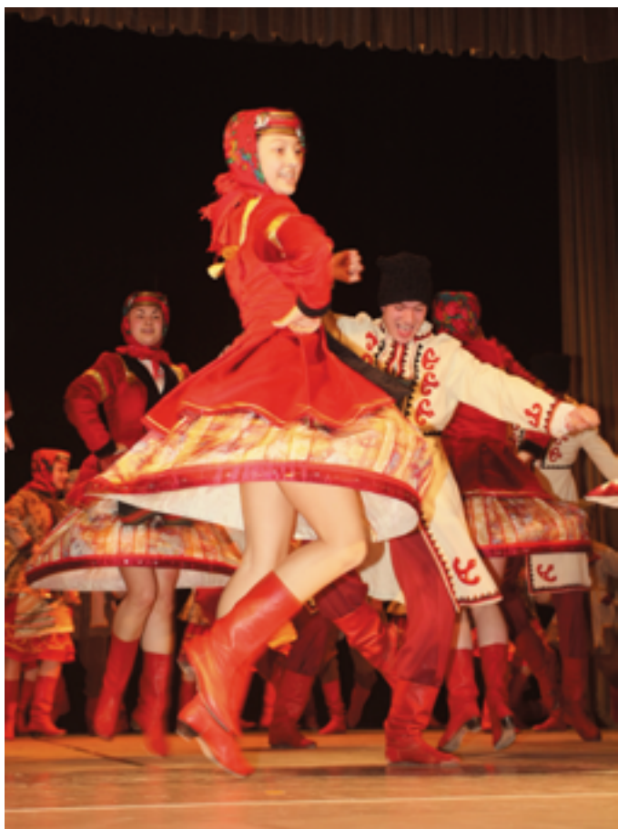
Zespół „Barwinok” podczas występu w Wojewodzkim Domu Kultury