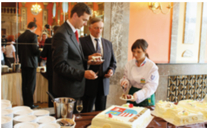
Uroczystości uświetniły jubileuszowe torty