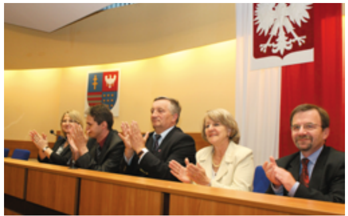
Dorose Prezydium Dziecięcego Sejmiku