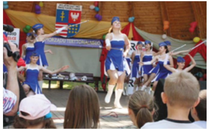
Roztańczone Mażoretki ze Skalbmierza

Dla uczestników Pikniku organizatorzy przygotowali wiele atrakcji. Były występy zespołów, pokazy oraz konkursy z nagrodami.