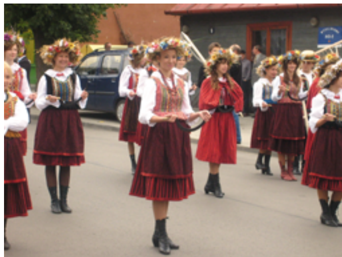
Barwny korowód dożynkowy przeszedł ulicami Opatowa