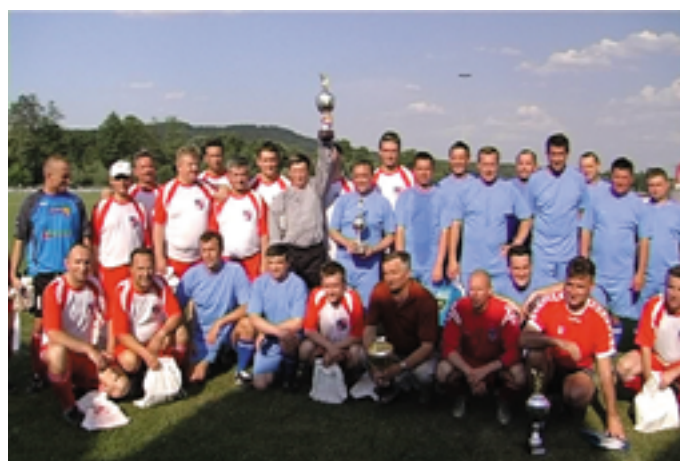
Reprezentacje Obwodu Winnickiego i Województwa Świętokrzyskiego przed pierwszym gwizdkiem