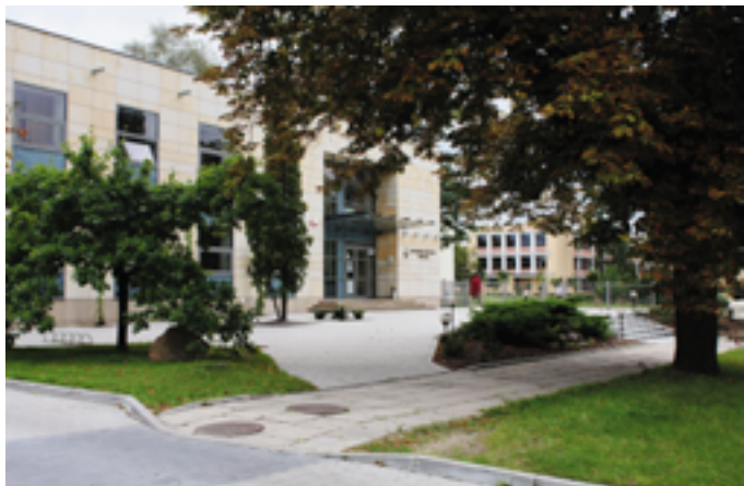
Nowy budynek Wojewódzkiej Biblioteki Publicznej przy ulicy Ściegiennego 13 w Kielcach

poziomowa czytelnia. Do nowego budynku przeniesiono Mediatekę, czyli bibliotekę udostępniającą filmy, muzykę, gry komputerowe i programy do nauki języków obcych na DVD. Inwestycja kosztowała ponad 13 mln zł, z czego ok. 11 mln stanowi dofinansowanie ze środków unijnych, w ramach Zintegrowanego Programu Operacyjnego Rozwoju Regionalnego 2004-2006.