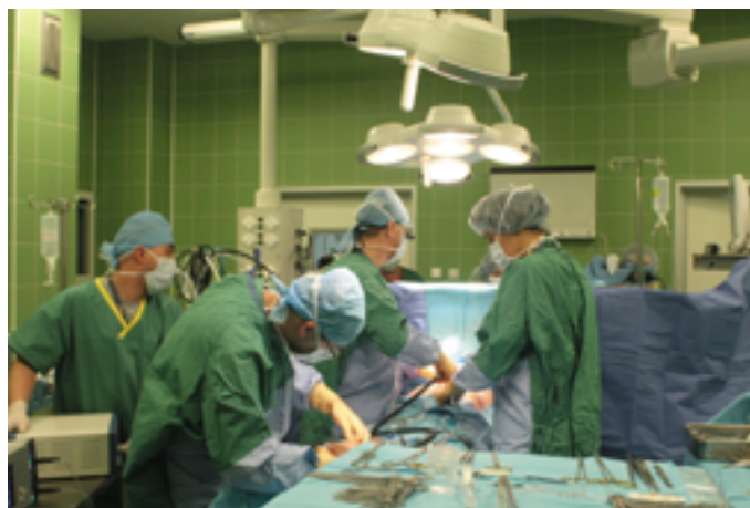
Pierwsza operacja na świętokrzyskiej Kardiologii

Uruchomienie kardiologii to jedna z najważniejszych inwestycji realizowanych w jednostkach służby zdrowia podległych Samorządowi Województwa. Do tej pory taki oddział był tylko marzeniem, a świętokrzyskie białą plamą na polskiej mapie kardiologii. Na operacje by-passów czy zastawek mieszkańcy regionu musieli jeździć do ośrodków w Krakowie, Zabrzu czy Aninie. Teraz tego typu operacje wykonywane są w Kielcach. Oddział powstał na bazie Świętokrzyskiego Centrum Kardiologii. Na jego potrzeby zostały zaadoptowane pomieszczenia na I i IV piętrze Centrum, z klimatyzowaną salą operacyjną i łóżkami pooperacyjnymi. Oddział jest wyposażony w najnowocześniejszą aparaturę. Uruchomienie kardiologii kosztowało prawie 9 mln zł. Starania o jego utworzenie trwały około 10 lat.