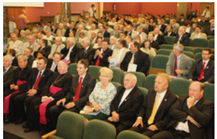
W sesji uczestniczyli samorządowcy i osoby zaangażowane w obronę województwa

Uroczysta sesja Sejmiku Województwa Świętokrzyskiego, wystawa fotografii dokumentująca walkę mieszkańców regionu o samodzielne województwo, debaty, spektakle, koncerty i Europejski Festyn Rodzinny towarzyszyły obchodom 10-lecia Województwa Świętokrzyskiego, które odbywały się od 4 do 7 września.