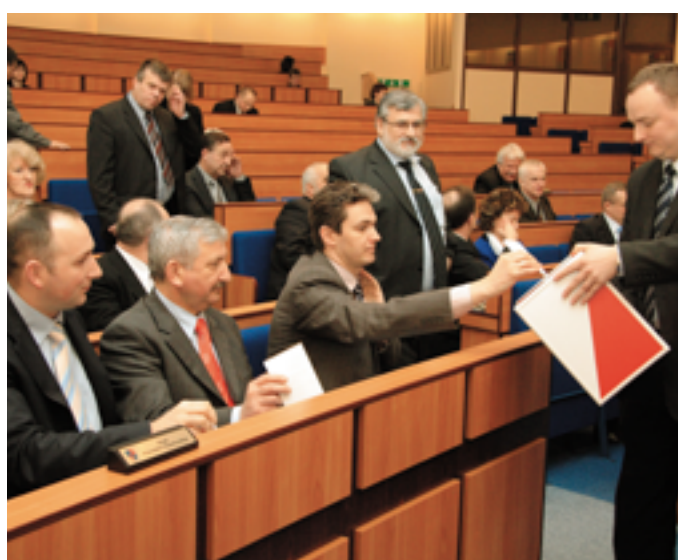
Decyzje radnych wędrują do urny