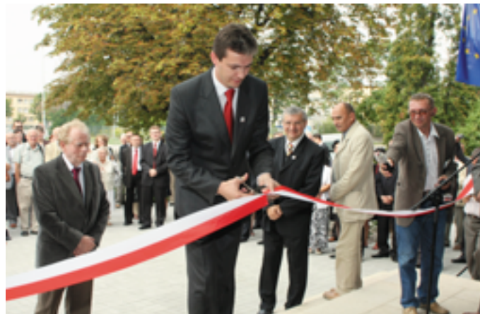
Symboliczne przecięcie wstęgi zainaugurowało nową erę w historii WBP