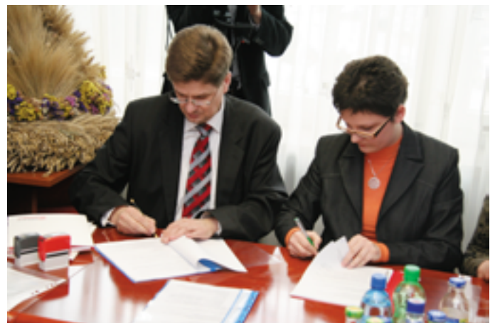
Podpisanie umowy na budowę Europejskiego Centrum Bajki

W lutym, przedstawiciele Europejskiego Centrum Bajki im. Koziołka Matołka i firmy Eifage Budownictwo Mitex S.A. podpisali w Urzędzie Marszałkowskim umowę na budowę Centrum Bajki. W przyszłym roku w miasteczku Koziołka Matołka powstanie wielofunkcyjny obiekt dla dzieci z muzeum, sala kinowa i teatralną, biblioteką, ogrodem ekologicznym i amfiteatrem. Inwestycja w Pacanowie jest mocno wspierana przez Samorząd Województwa. W ubiegłym roku Sejmik przeznaczył na budowę Europejskiego Centrum Bajki 5,3 mln zł. W październiku tego roku Zarząd Województwa wspólnie z wojewodą świętokrzyskim zdecydowali o przekazaniu na realizację projektu dodatkowych 2 mln 300 tys. zł z budżetu państwa. Europejskie Centrum Bajki, którego otwarcie planowane jest w 2009 r. odwiedził sekretarz stanu w Ministerstwie Kultury i Dziedzictwa Narodowego Piotr Żuchowski.