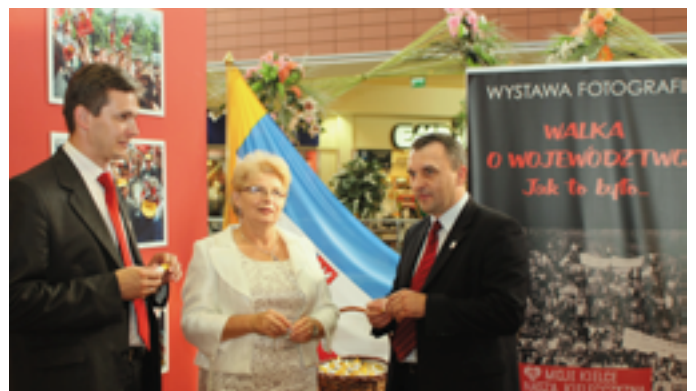
Uroczyste otwarcie wystawy „Walka o województwo - Jak to było”