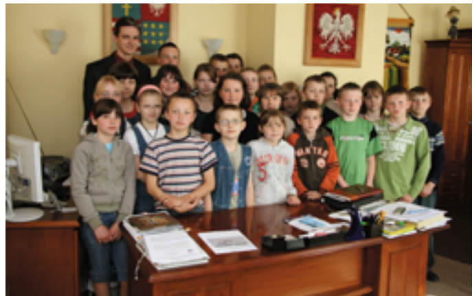
Uczniowie Szkoły Podstawowej w Śniadce podczas wizyty u Marszałka