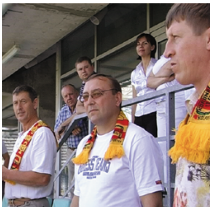
Goście z Ukrainy na stadionie Korony Kielce