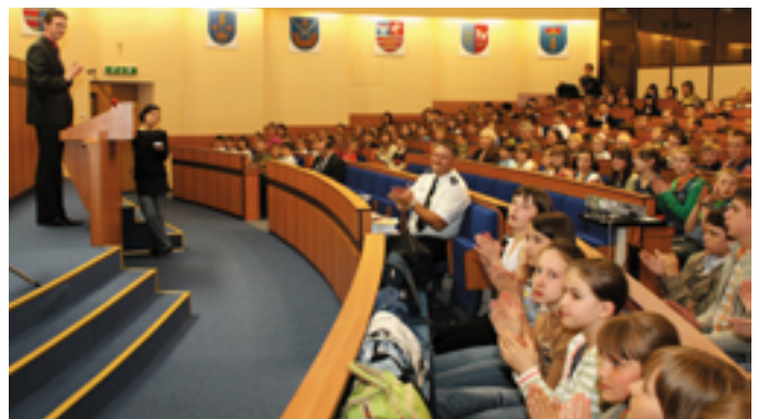
Młodzi radni województwa świętokrzyskiego stawili się w komplecie