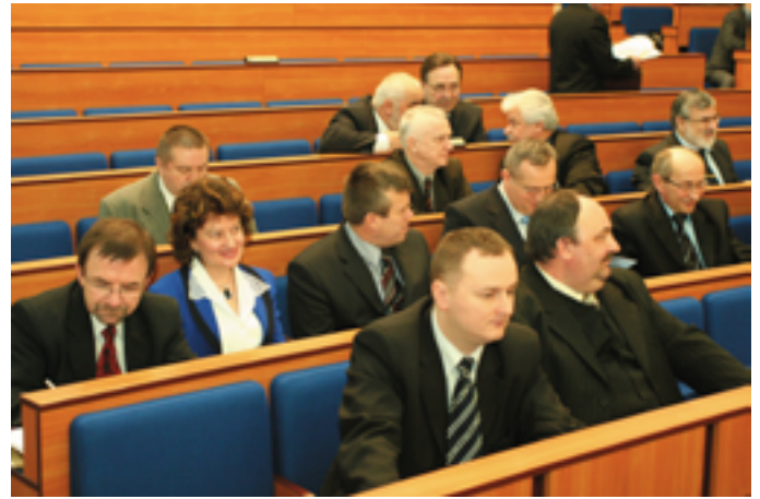
W minionym roku podjęli 139 uchwał...

Ich efektem było przyjęcie 162 opinii, 4 stanowisk i 6 wniosków.