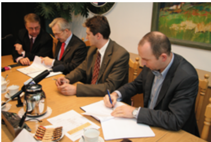
Duża kwota z RPO wesprze też Świętokrzyskie Centrum Onkologii