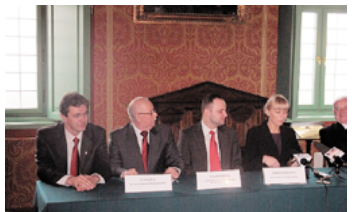
- To niezwykle ważna chwila dla naszej uczelni mówił rektor Politechniki Świętokrzyskiej Stanisław Adamczak

Przedsięwzięcie ma zostać zakończone w 2012 r. i pochłonie w sumie ponad 125 mln złotych, z czego ponad 80 mln zł. to środki Europejskiego Funduszu Rozwoju Regionalnego.