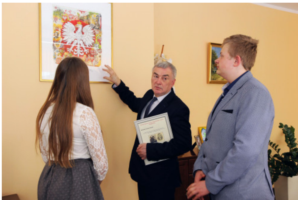
Spotkanie marszałka z gimnazjalistami