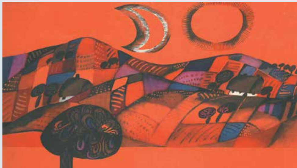
▲ Z Piektła Rodem , Maria Kędzierzyna, ilustracje Ewa Fryszak-Szchemiot, Wydawnictwo Literackie Kraków