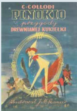
◀ Pinokio , C. Collodi, ilustracje Jan Marcin Szancer, Książka i Wiedza, 1951 r.