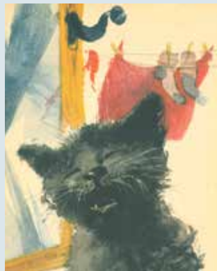
▼ Franek , Maria Konopnicka, ilustracje Janusz Grabiński, Nasza Księgarnia, 1968 r.

„W ciągu ostatnich dziesięcioleci usiłowano zastąpić lub wzbogacić tradycyjne książki cyfrowymi ekwiwalentami. Postęp w produkcji e-atramentu stosowanego w czytnikach doprowadził do rozwoju e-książek, to kolejny krok na drodze do wzbogacenia tradycyjnej książki papierowej elektronicznymi funkcjami, podobnymi do tych znanych z audiobooków, książek multimedialnych na CD-ROM-ach, książek online i elektronicznych.”