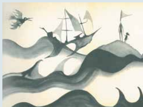
▲ Omijajcie wyspę Hula , Marta Tomaszewska, ilustracje Gabriel Rechowicz, Nasza Księgarnia, 1968 r.