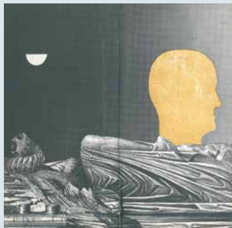
▼ Nowa cywilizacja , Zbigniew Przyrowski, ilustracje Alina i Daniel Mrozowie, Nasza Księgarnia, 1973 r.

społeczeństwa. Graficy wykorzystali sprzyjającą sytuację na rynku wydawniczym, pod silnym państwowym mecenatem, zapewniającym nieprzerwaną, obfity strumień zamówień zgodnych z obowiązującą doktryną.