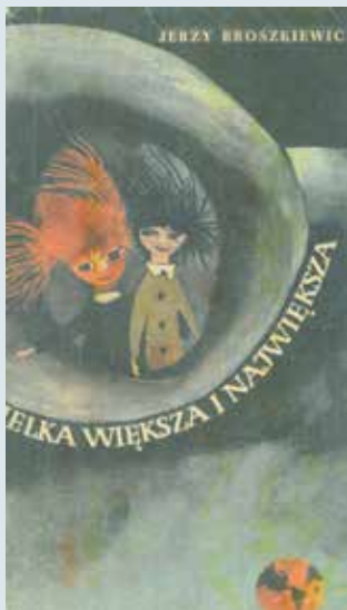
▲ Wielka, większa i największa , Jerzy Roszkiewicz, ilustracje Gabriel Rechowicz, Nasza Księgarnia, 1966 r.