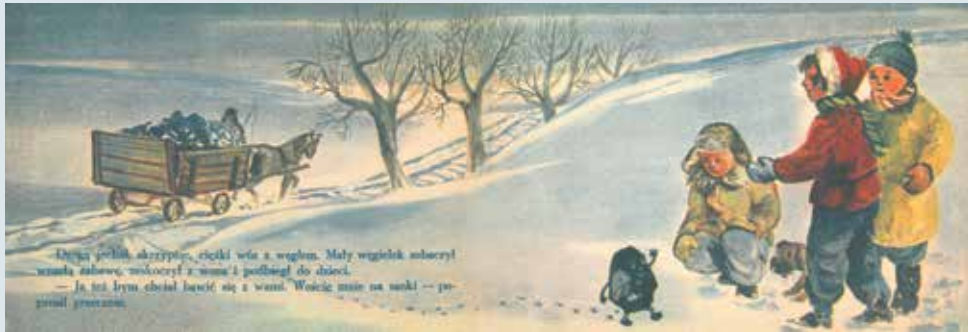
▲ Rozgniewany Węgiełek , A. Sekora, ilustracje Mateusz Gawryś, Nasza Księgarnia, 1954 r.