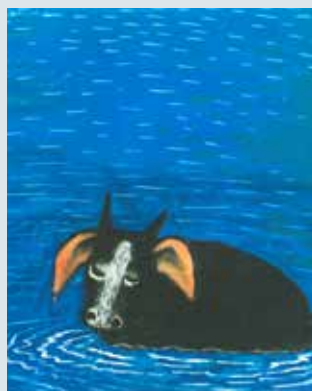
▲ Kraina sto piątej tajemnicy , Zbigniew Żakiewicz, ilustracje Józef Wilkoń, Czytelnik, 1977 r.