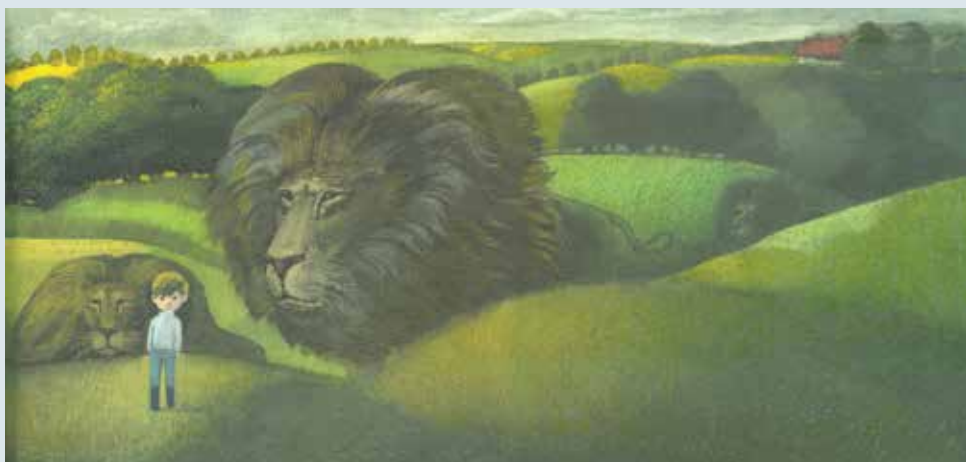
▼ LWY , Hanna Januszewska, ilustracje Janusz Stanny, Biuro Wydawniczo-propagandowe, 1974 r.

ją zgodnie z własnym charakterem, kulturą, wrażliwością i estetyką, przeżywamy własną opowieść.