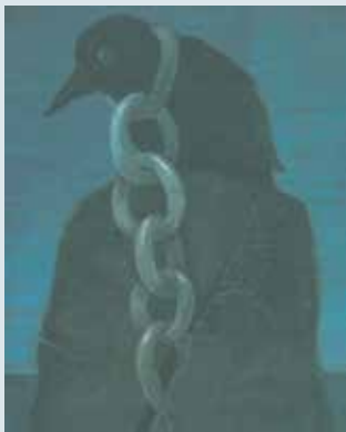
► Król Kruków , Paul Delarue, ilustracje Stasys Eidrigėvičius