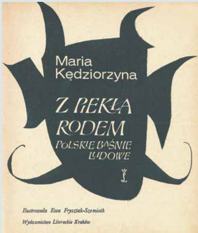
▶ Z Piekła Rodem , Maria Kędzierzyna, ilustracje Ewa Fryszak-Szemieth, Wydawnictwo Literackie Kraków