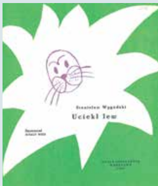
▲ Uciekł lew , Stanisław Wygodzki, ilustracje Ignacy Witz, Nasza Księgarnia, 1965 r.