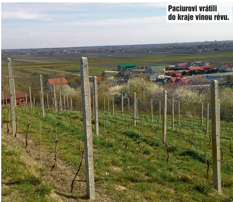
Paciurovi vrátili do kraje vinou révu.

→ polsko.travel/cz – velmi užitečné stránky polské organizace cestovního ruchu s databází míst a akcí, které lze v Polsku navštívit. Mají i českojazyčnou verzi.