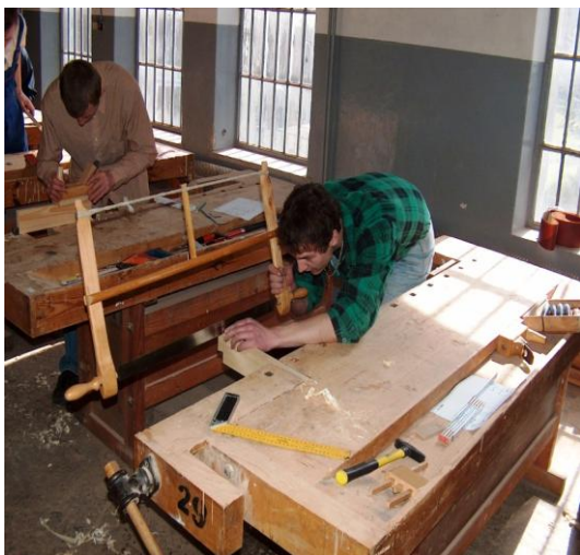
Posługiwanie się narzędziami jest tutaj cenną umiejętnością