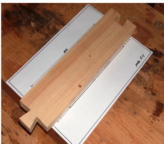
Efekt pracy. Gotowy element.

Kryteria oceny prac konkursowych obejmują ocenę dokładności wykonania – wymiarów gabarytowych i profili, strugania, piłowania, dłutowania, trasowania oraz estetyki wykonania pracy. Ponadto ocenie podlega organizacja stanowiska pracy, poszanowanie narzędzi, ład na stanowisku, czas wykonania w stosunku do przewidzianego na wykonanie zadania, przestrzeganie przepisów BHP jak, zachowanie ucznia, ubiór, posługiwanie się narzędziami.