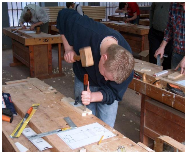
Wykonanie poprawne zadania zgodnie z rysunkiem wymaga dużej uwagi i dokładności