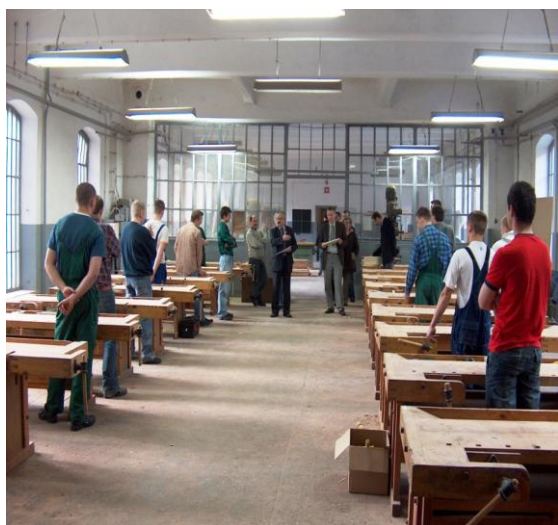
Część praktyczna, omówienie przebiegu wykonania zadania praktycznego

W części praktycznej uczniowie mają za zadanie wykonać za pomocą obróbki ręcznej element z drewna litego zgodnie z otrzymanym rysunkiem oraz rozwiązują ćwiczenie polegające na wykazaniu się umiejętnościami rozpoznawania gatunków drewna, rodzaju narzędzi, rodzaju obróbki i materiału lub typu konstrukcji, za które mogą uzyskać w konkursie stolarz 60 punktów, a w konkursie technik 40 punktów.