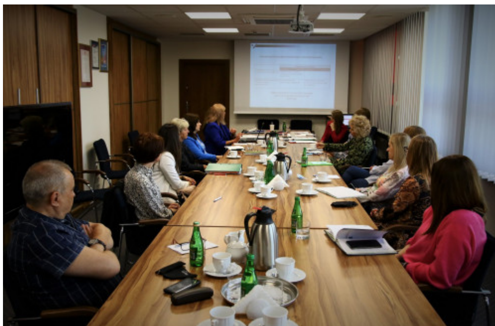
Pracownicy Zespołu Do Spraw Kontroli Zarządczej Podczas Spotkania