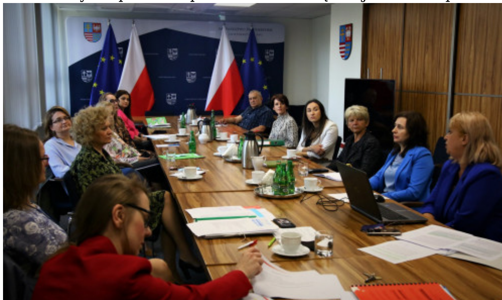
Koordynatorzy Do Spraw Kontroli Zarządczej Podczas Omawiania Zasad Funkcjonowania Systemu Kontroli Zarządczej