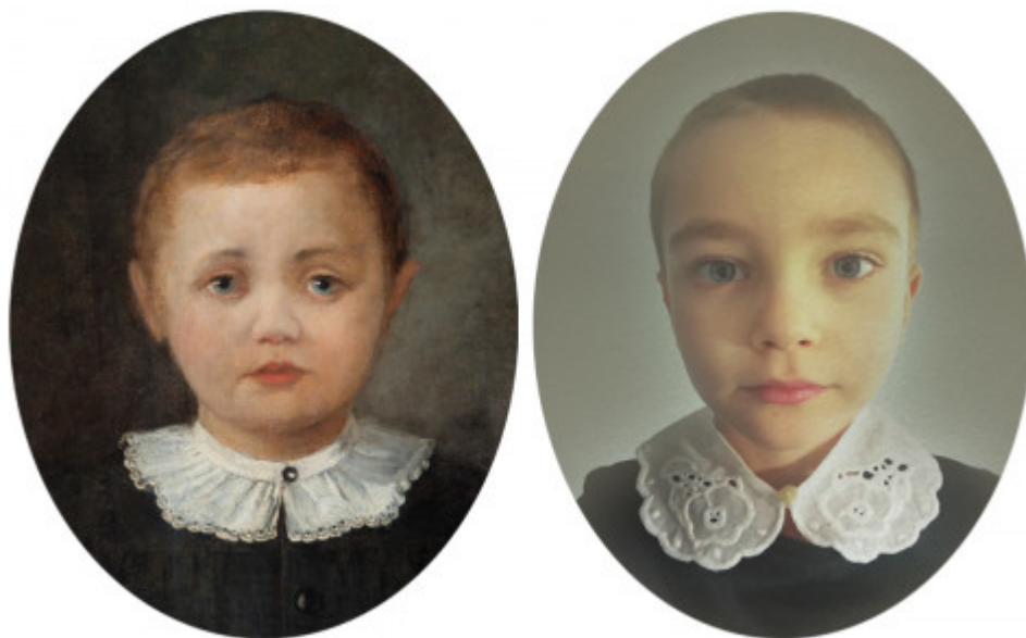
Aleksander Kotsis, Portret chłopca, ok. 1865 r.