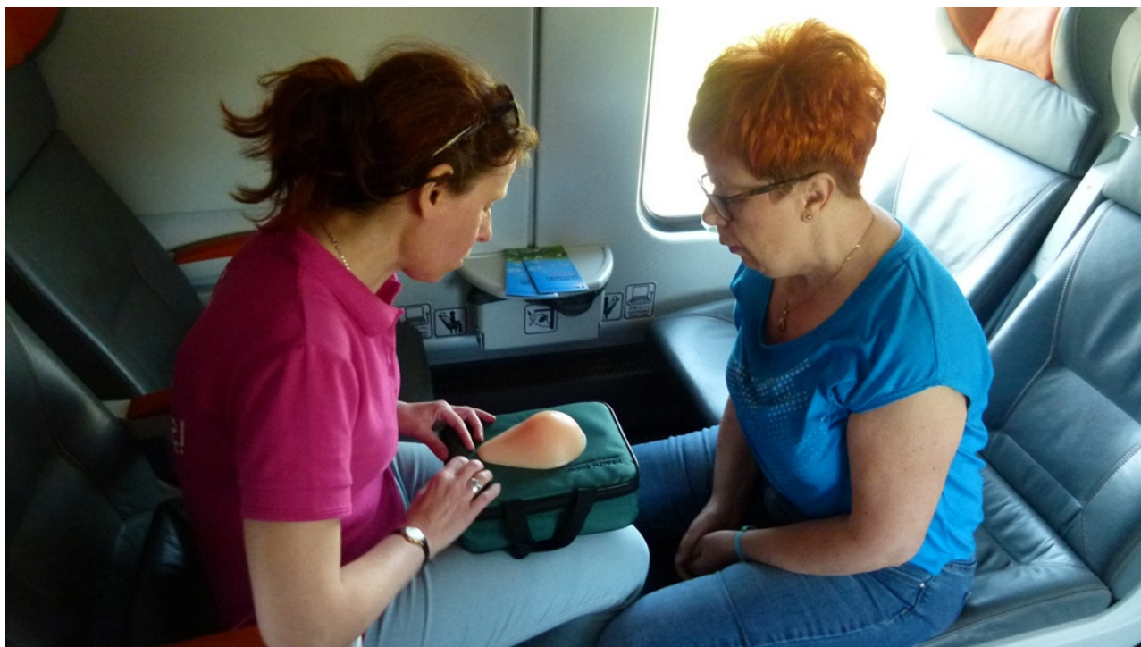
Nauka samobadania piersi

Do badań profilaktycznych zachęcaliśmy w „Pociągu do zdrowia” relacji Kielce - Sandomierz (akcja Urzędu Marszałkowskiego Województwa Świętokrzyskiego 28 kwietnia), podczas festynu „Zdrowie kochamy, więc się badamy” - inicjatywy Stowarzyszenia Projekt Świętokrzyskie, a także w trakcie kampanii profilaktycznej „Biegnij czysto, żyj” zorganizowanej w Szkole Podstawowej 25 w Kielcach przez osoby współpracujące z ośrodkiem terapii uzależnień w Chęcinach oraz środowisko biegaczy ze Ślichowic. W cytobusie badały się biegaczki, rowerzystki, turystki, gospodynie wiejskie i miejskie, mamy zabiegane i kobiety pracujące, żadnej pracy się nie bojące. Wszystkie panie otrzymały zestawy upominków przypominające o profilaktyce.