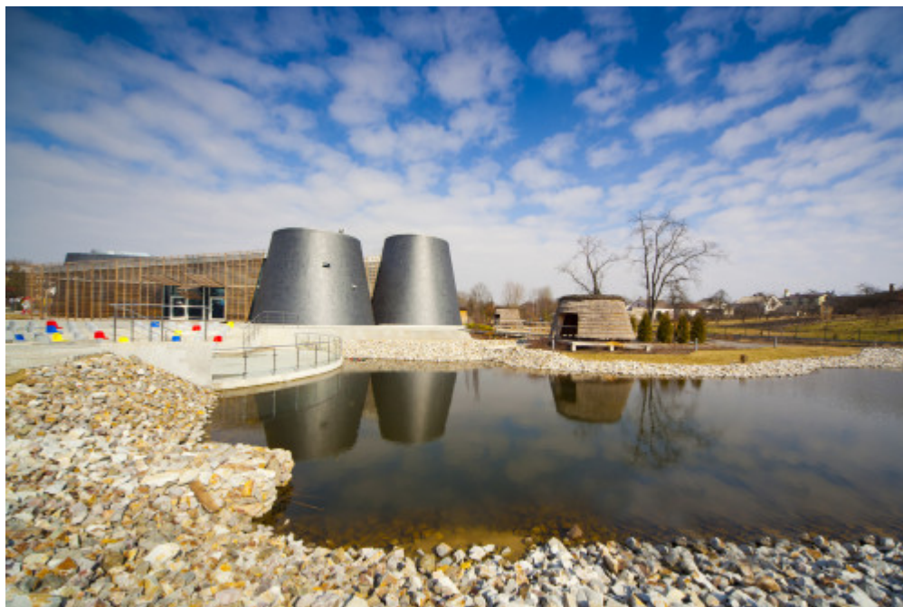
Europejskie Centrum Bajki w Pacanowie.

Jednocześnie, jak wynika z rankingu, w ubiegłym roku w kilku świętokrzyskich atrakcjach turystycznych odnotowano spadek liczby odwiedzających. Może to być związane z faktem, iż w 2019 roku wiele wycieczek szkolnych, do których głównie kierowane są oferty niektórych obiektów, zostało odwołanych z powodu strajku nauczycieli. Mniej turystów pojawiło się m.in. w Kompleksie Świętokrzyska Polana, zespole pałacowym w Kurozwękach czy Centrum Kulturowo-Archeologiczne w Nowej Słupi.