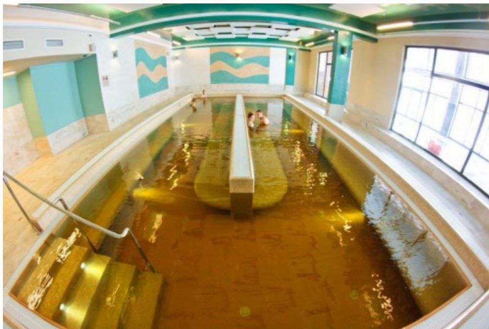
Basen z wodą siarczkową w Solcu-Zdroju.

Dużym zainteresowaniem najmłodszych podróżników cieszyło się Europejskie Centrum Bajki w Pacanowie , które przyjęło 211 130 osób i odnotowało wzrost liczby gości o 19 tysięcy.