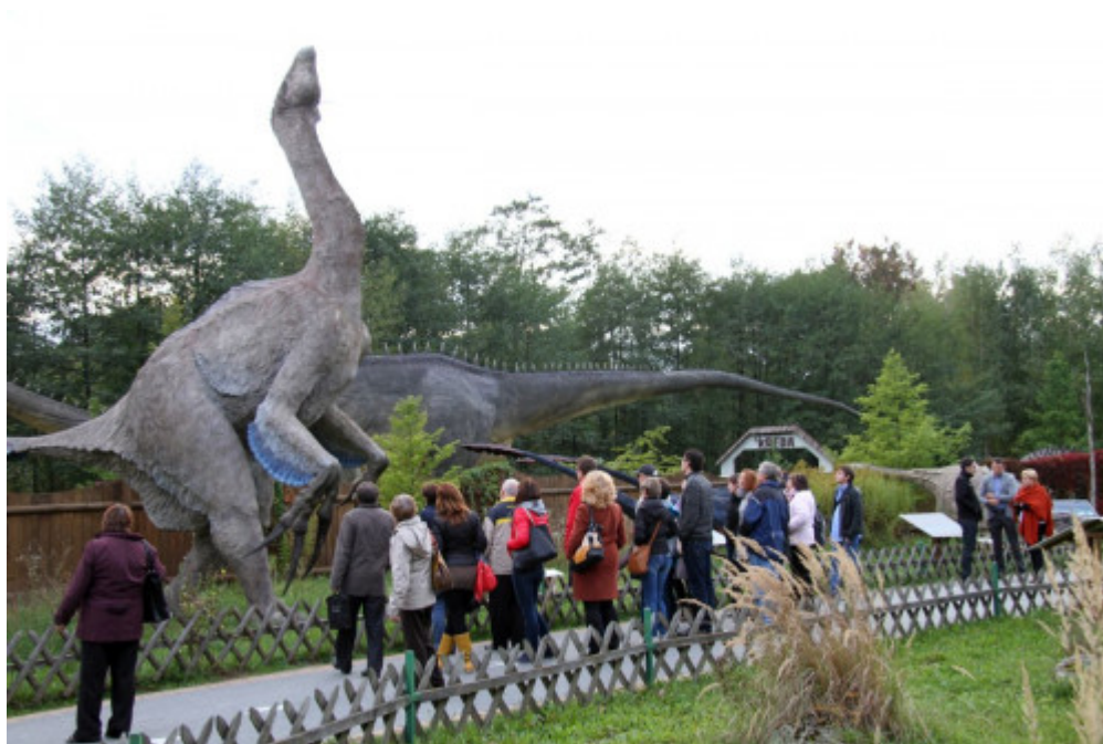
W bałtowskim Jura Parku.

Na drugim miejscu podium rozgościła się świętokrzyska perła, miejsce szczególne dla całego regionu czyli klasztór na Świętym Krzyżu , który odwiedziło 350 137 osób czyli prawie 10 tysięcy więcej niż w 2018 roku.