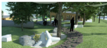
OSRODOK LEGENDA KIDOLNIA W PAŁACU PRUSOCIN