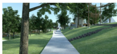
OSRODOK LEGENDA LĄSKA Z KOSMITY SOŁE W KIDOLNI PAŁACU PRUSOCIN