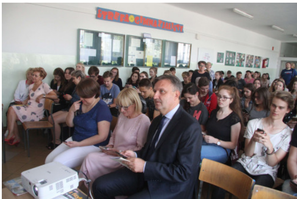
Spotkanie w IV LO w Kielcach

W Kielcach w akcję Narodowego Czytania włączyło się Muzeum Narodowe, a jej początek przewidziano na godzinę 9.00, w nietypowym miejscu, bo w autobusie linii OW. W pojazdach w ciągu pięciu kolejnych kursów odczytywane będą najbardziej znane fragmenty lektury. Następnie od godziny 10 przy Willi Dyrektora Gimnazjum na ulicy Jana Pawła II 8, młodzież z kieleckich szkół czytać będzie fragmenty dzieła Stefana Żeromskiego w wyjątkowych aranżacjach. W południe rozpocznie się spacer po Kielcach śladami Stefana Żeromskiego, zbiórka uczestników przed wejściem do Muzeum Lat Szkolnych pisarza przy ulicy Jana Pawła II 5.